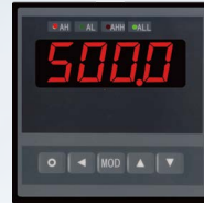
■ C1规格96×96 基本型面板