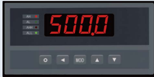
■ A1规格160×80 基本型面板