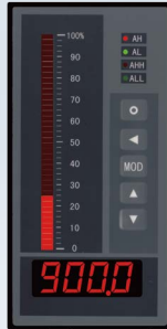
■ B3规格80×160 光柱型面板